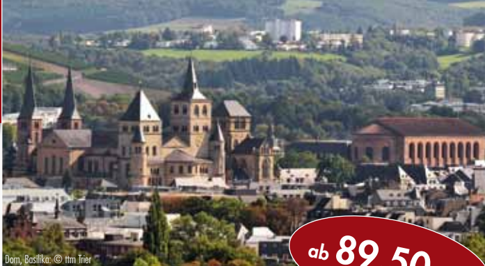
Dom, Basilika